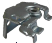
Étrier face / plafond de série