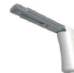
Equerre MM 100-150 mm