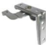
Étrier face / plafond de série