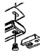
Par câbles acier au sol