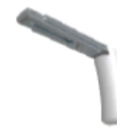
Equerre MM 100-150mm