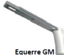
Equerre GM 150-250 mm