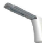
Equerre MM 100-150mm