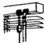
Cordon de série