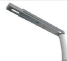
Equerre GM 150-250mm