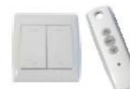
Moteur 230 V filaire ou radio