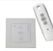
Moteur 230 V filaire ou radio