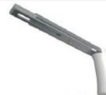
Equerre GM 150-250mm