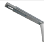
Equerre GM 150-250mm