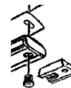
Par câbles acier au sol