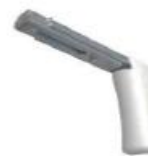
Equerre MM 100-150mm