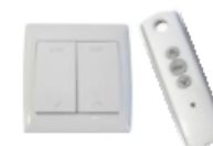
Moteur 230 V Filaire ou radio